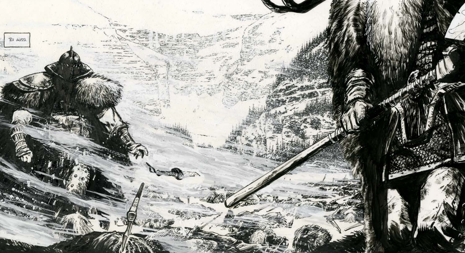
encre de Chine sur papier, détail d'une case