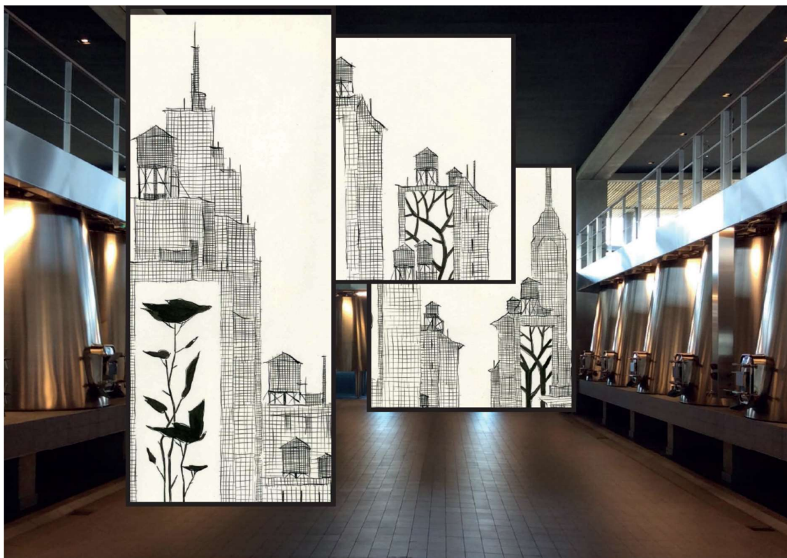
Simulation d'installation dans le cuvier du Château Beychevelle de 3 toiles suspendues

Aujourd'hui encore, l'esprit de mécénat est gravé dans la pierre du château. Celui-ci organise de nombreux événements où patrimoine bordelais et artistes contemporains s'attachent à créer de nouveaux espaces de liberté créative. Pour le château Beychevelle, concerts de jazz, expositions et art sont porteurs d'unité entre les hommes de cultures, d'horizons et de temps différents.