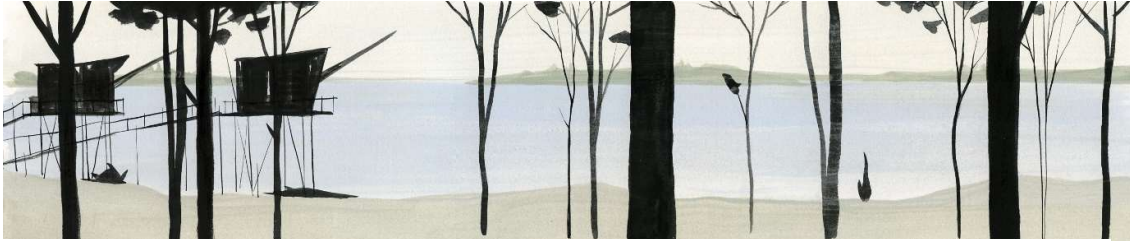
Fresque de 20 mètres exposée dans les anciens chais du Château Beychevelle

Exposition du 12 juin au 10 septembre 2019