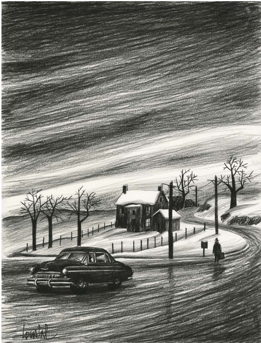
Le passager clandestin – Un nouveau dans la ville – Illustration | Fusain sur papier, 65x50 cm