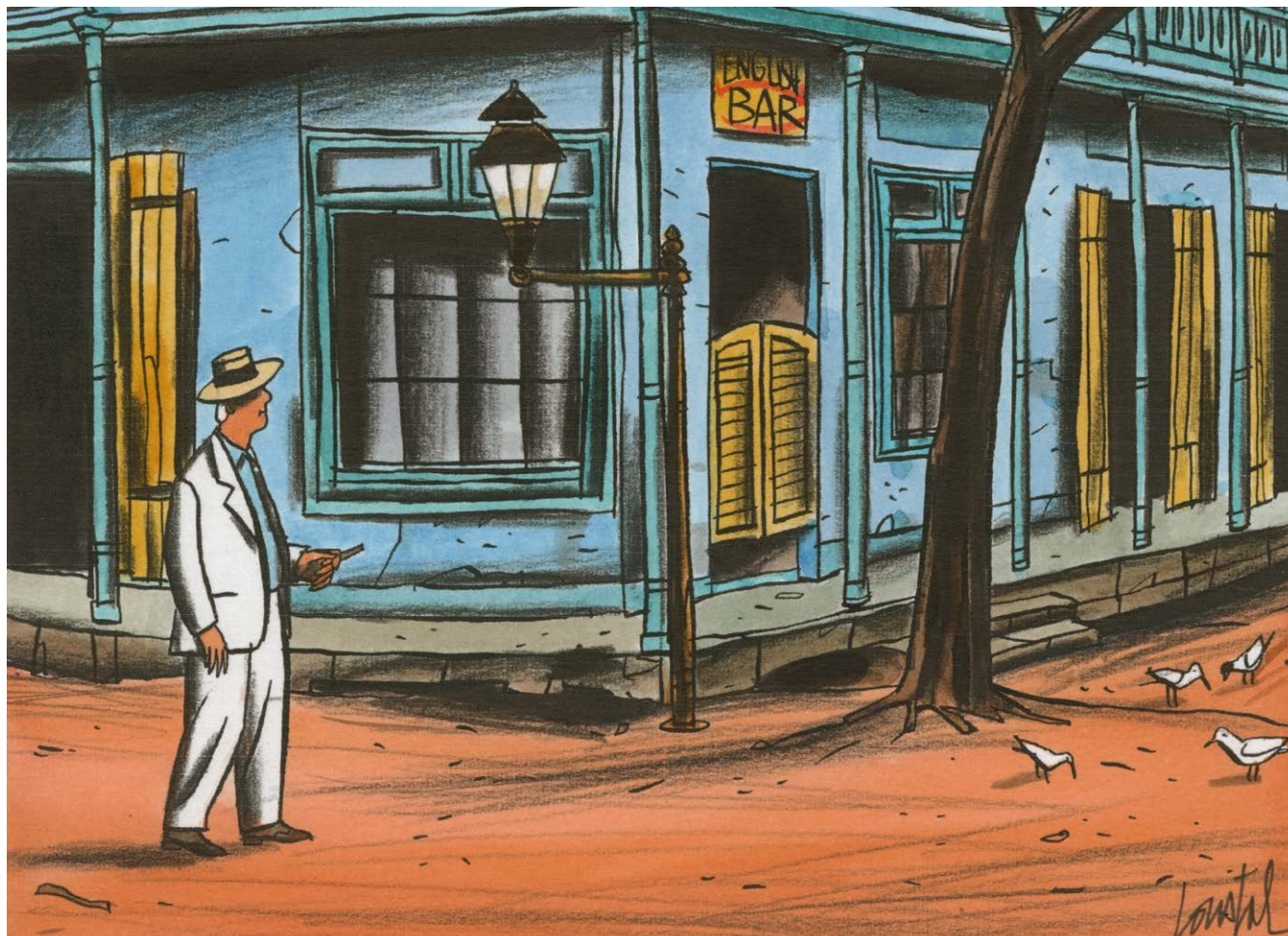
Le passager clandestin – Illustration XV (détail) Technique mixte sur papier, 26x18 cm