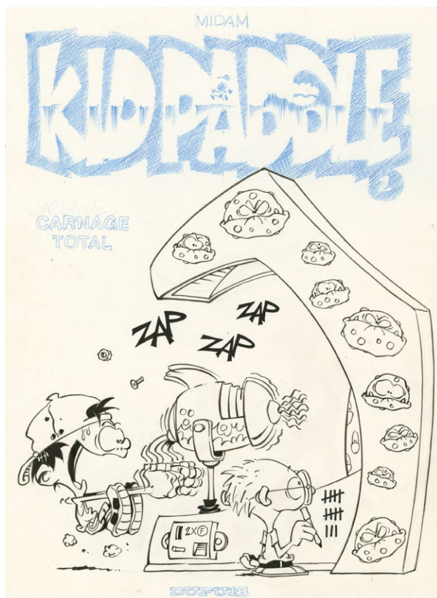
Kid Paddle – Carnage total – Couverture

Amateurs et collectionneurs pourront découvrir l'univers de l'auteur à travers un parcours en deux temps. D'une part, un itinéraire retraçant la carrière de l'artiste depuis ses débuts dans le magazine Spirou jusqu'à l'affirmation de ses deux créations emblématiques Kid Paddle et Game Over . Un second espace d'exposition accueillera les dernières créations grand format de Midam dans une mise en scène intitulée New-Blorck City . Inspiré par le Street Art, l'auteur s'affranchit ici des cases, en proposant dans ses œuvres une vision décalée de l'univers consumériste de la Big Apple avec beaucoup d'humour.