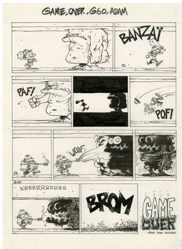
Game Over – No problemo – Page 10 – Gag 60