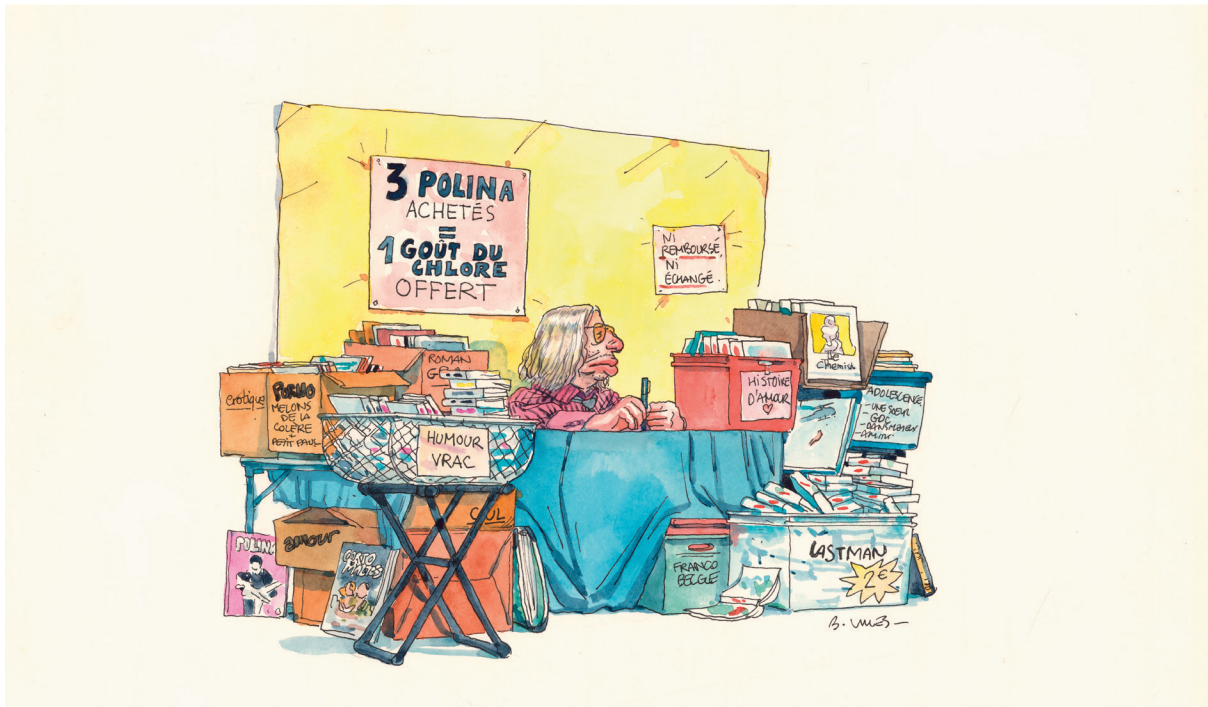
3 Polina achetés = 1 goût du chlore offert - Aquarelle et encre de Chine sur papier - 21 x 27 cm