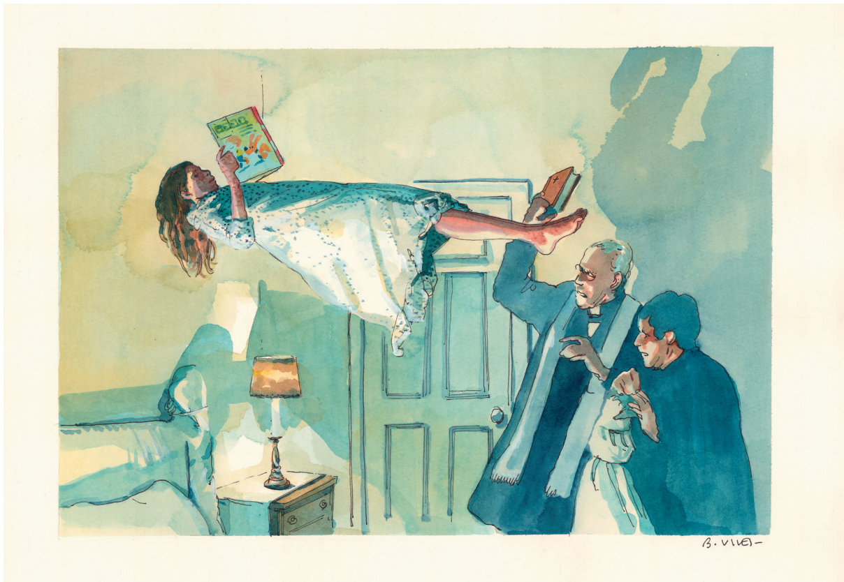
Va-t'en Satan! - Aquarelle et encre de Chine sur papier - 24 x 34 cm