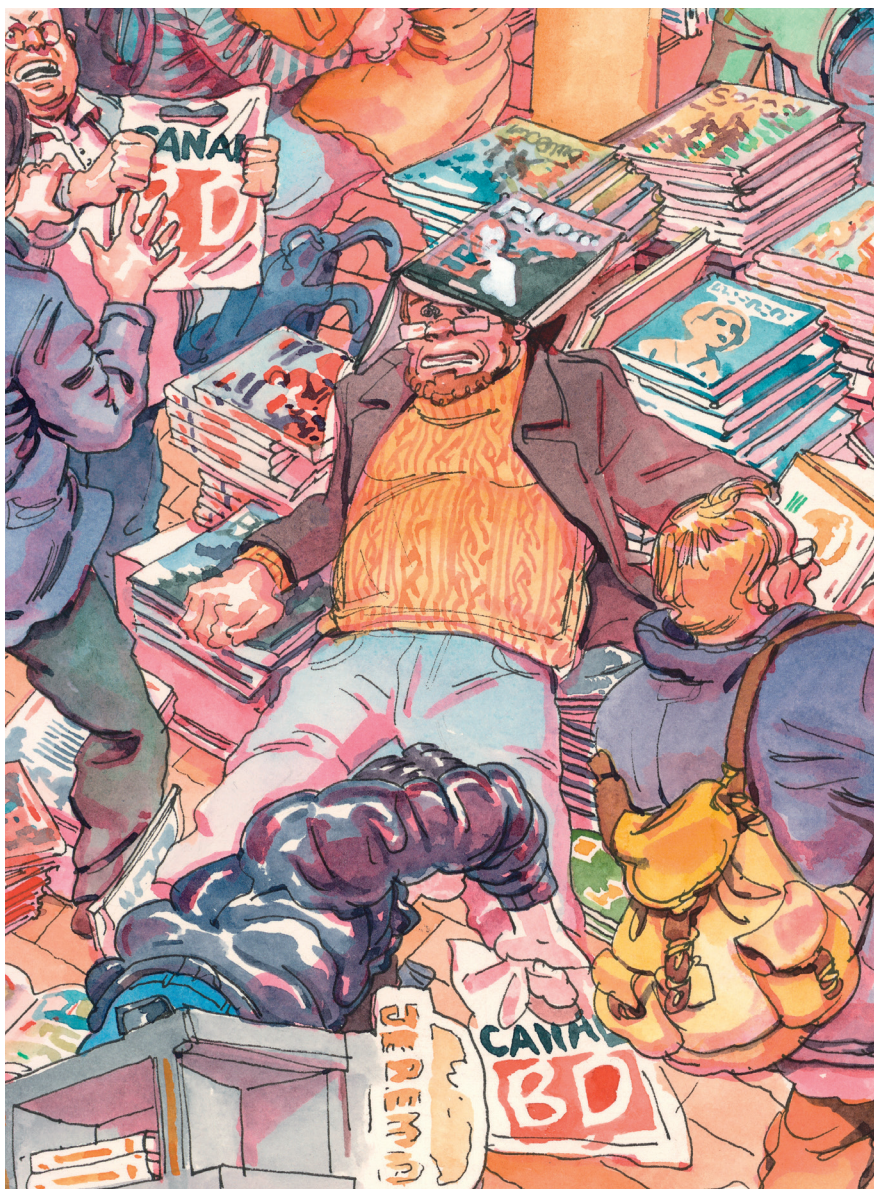
Bulles en délire - Aquarelle et encre de Chine sur papier - 40 x 55 cm (détail)