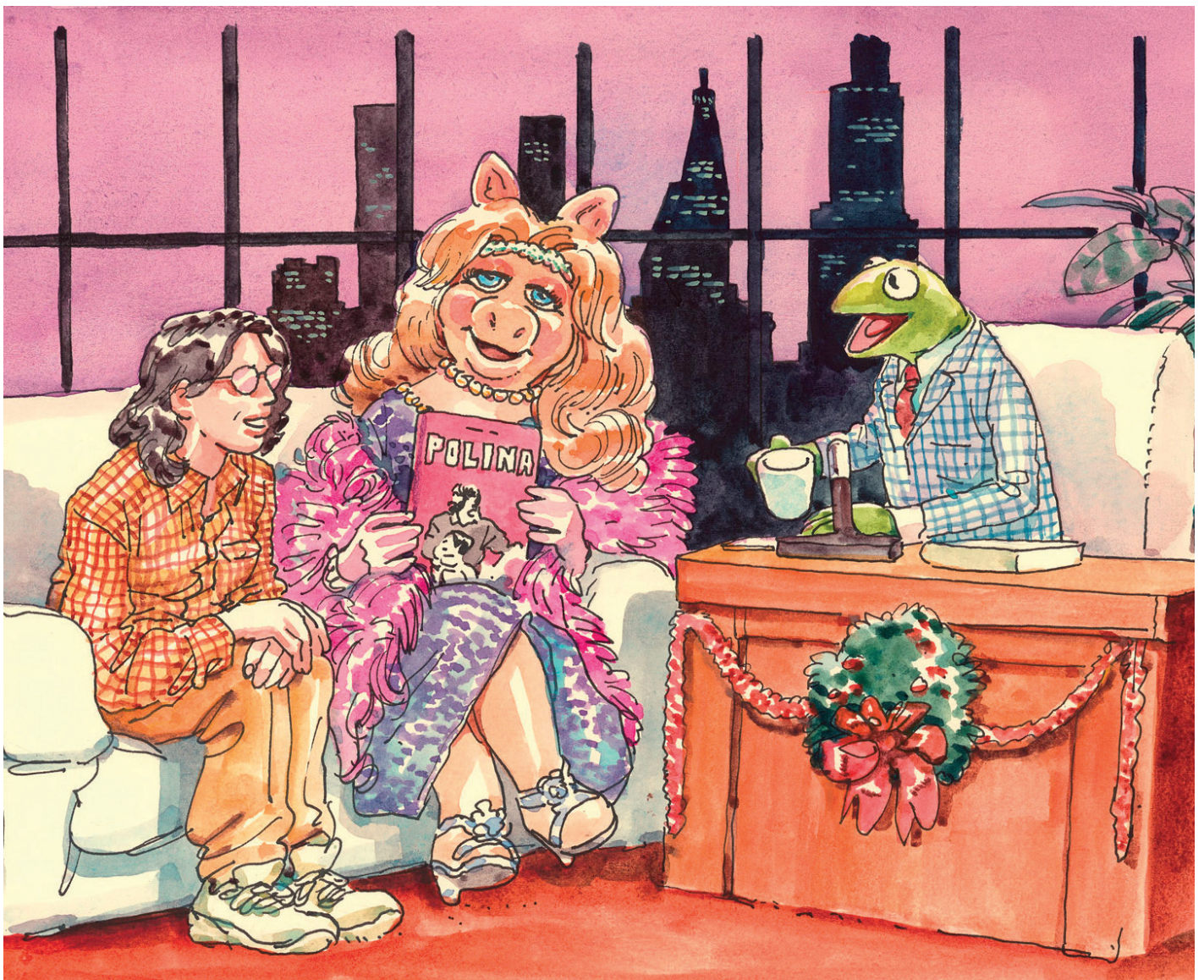
The Late Show - Aquarelle et encre de Chine sur papier - 20 x 28,5 cm

Il crée des images qui interpellent, parfois clivantes, paradoxales, ambiguës. Happé par ses propos, on en oublierait la technique, alors même que pour quelqu'un dont on connaissait depuis des années le travail numérique, comme celui en noir et blanc, il prouve avec cette exposition une maîtrise éclatante de l'aquarelle.