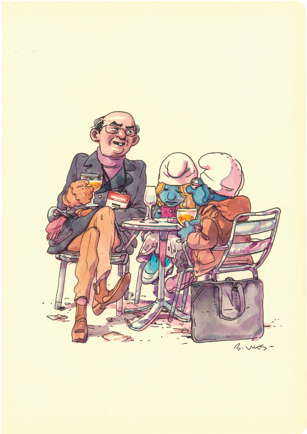
Rue Herge - Aquarelle et encre de Chine sur papier - 16 x 16 cm