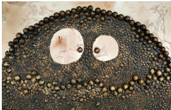
Midam - Blorkus Selfius , 2020, Huile, aquarelle, gaze médicale, pâte à relief et coquilles d'oeufs sur toile, 80 x 120 cm