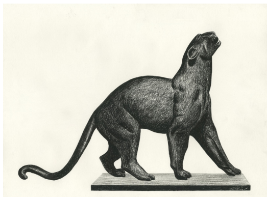
Loustal - Une Panthère - Objets rencontrés à la BRAFA , Fusain sur papier, 47,6 x 69,2 cm © Huberty & Breyne - LOUSTAL

Pour cette édition de « Brafa in the galleries », Alain Huberty & Marc Breyne mettront à l'honneur les artistes qu'ils soutiennent depuis plusieurs années, via une sélection d'œuvres qui font la part belle à la Bande Dessinée, l'illustration et l'art de manière générale.