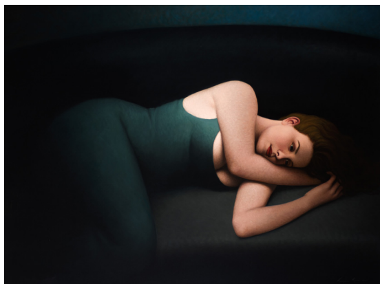
François Roca - Sans titre 1 , Huile sur toile, 97 x 130 cm