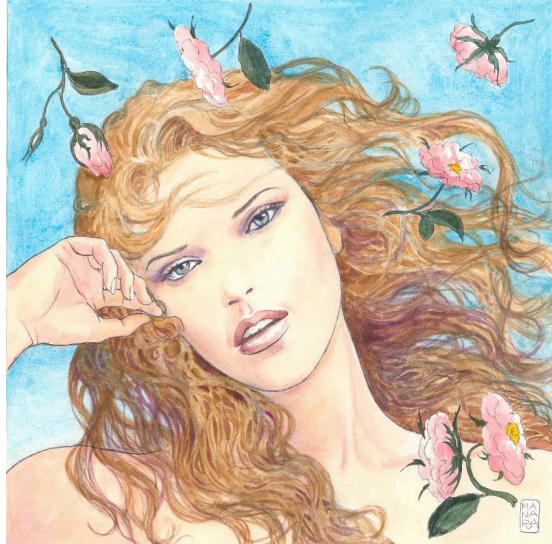
Milo Manara - Sans titre 1 , 2021 Aquarelle sur papier, 36,5 x 36 cm