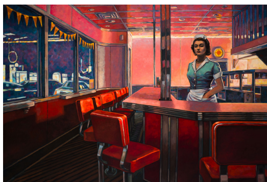
Miles Hyman - Melrose Diner , 2021 Huile sur lin, 114 x 162 cm © Huberty & Breyne - Miles HYMAN