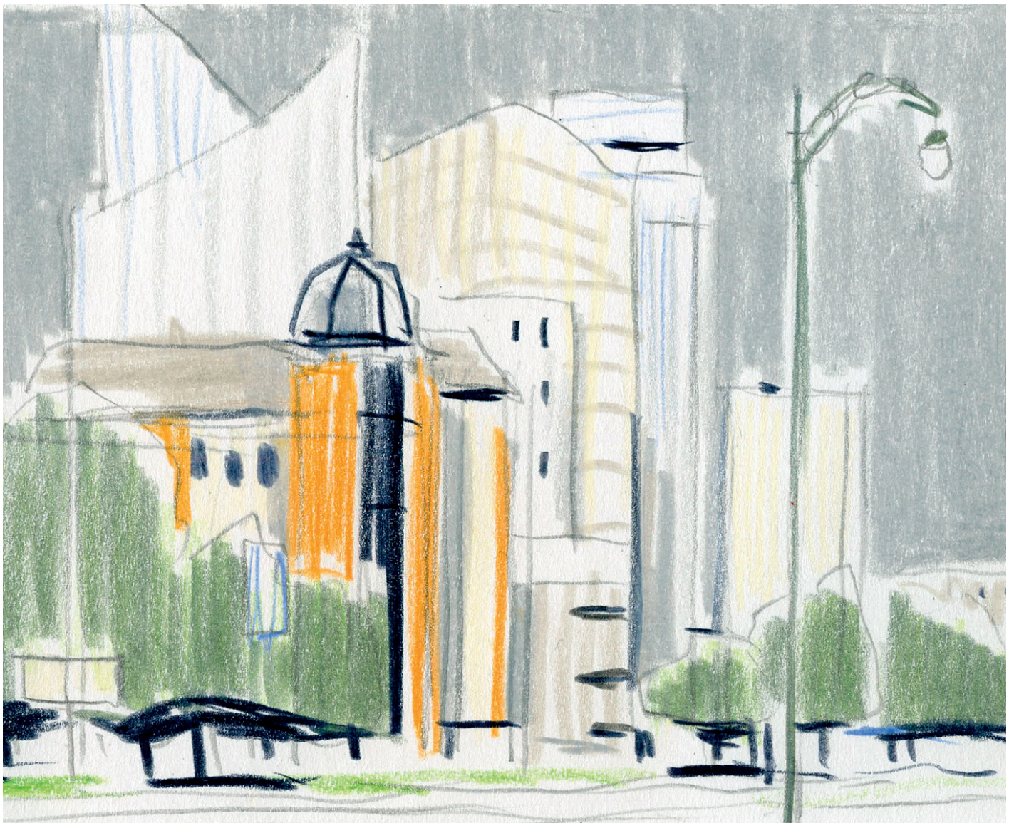
BXL 9 - Dessin préparatoire - Crayons de couleur sur papier - 2024