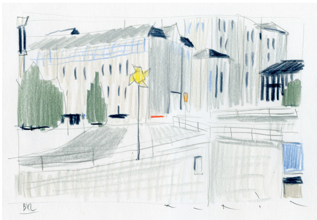
BXL 3b - Dessin préparatoire - Crayons de couleur sur papier - 2024

À cette occasion SKIRA, en coédition avec la galerie Huberty & Breyne, consacre un ouvrage rassemblant une centaine de toiles réalisées par l'artiste au cours de ces 12 dernières années.