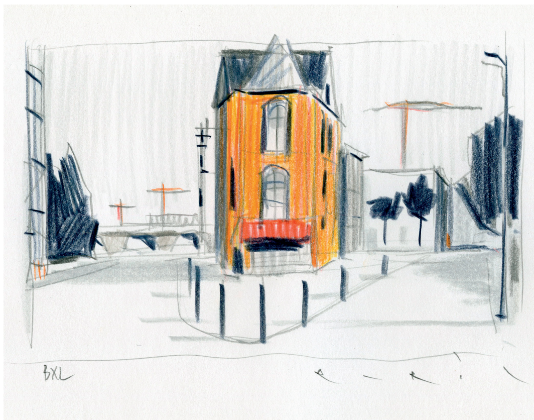
BXL 10 - Dessin préparatoire - Crayons de couleur sur papier - 2024