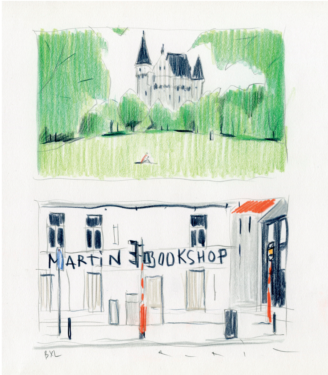
BXL 3 - Dessin préparatoire - Crayons de couleur sur papier - 2024