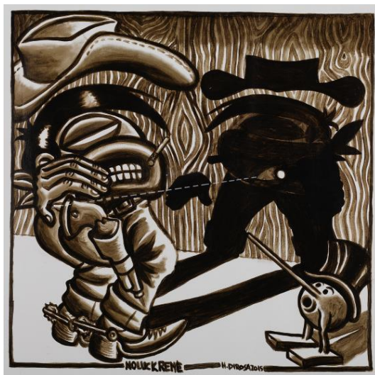
Hervé DI ROSA No Luck René - Hommage à Morris Acrylique sur toile - 2015