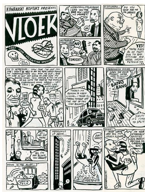
Conrad BOTES Planche originale issue d'un album de Bitterkomix

Référence incontournable dans le monde du 9 ème Art, la Huberty & Breyne Gallery prendra part, pour la quatrième année consécutive, à Art Paris. A l'occasion d'une édition placée sous le sous le signe de l'Afrique, Alain Huberty et Marc Breyne plongent dans l'univers Underground de la Bande Dessinée sud-africaine en mettant en lumière le travail d'Anton Kannemeyer et Conrad Botes, fondateurs de la revue d'avant-garde Bitterkomix . Créée en 1992 par ces deux artistes originaires du Cap, Bitterckomix (littéralement bande dessinée amère) est une publication engagée politiquement, longtemps censurée. Dans un registre trash et volontairement provocateur, elle illustre avec cynisme les dérives de la société sud-africaine et les bouleversements nationaux tels que l'abolition de l'apartheid. A travers une sélection de planches originales corrosives, l'accrochage revient sur l'histoire de ce magazine aujourd'hui devenu culte sur tout le continent, présentées aux côtés des œuvres récentes des artistes.